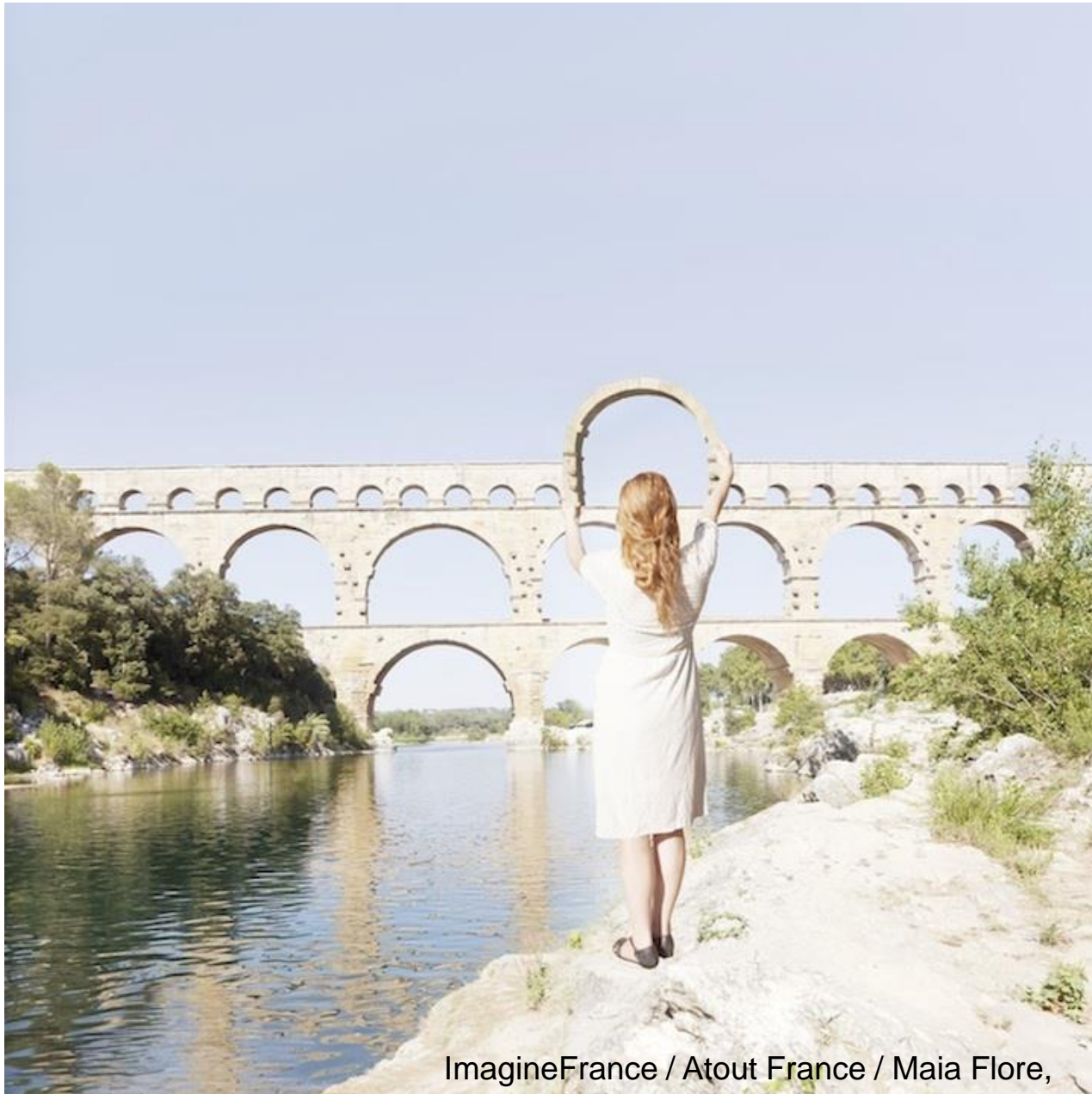
ImagineFrance / Atout France / Maia Flore, 2014